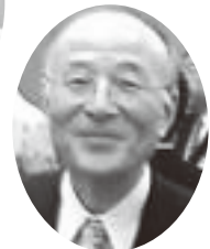
橋本五郎 ジャーナリスト