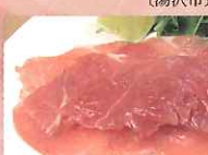
生ハム (白神フーズ(株))