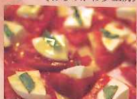
トマト/チーズ (なるせ加工研究会/明通りチーズ工房)