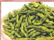
あきた香り五葉(枝豆)