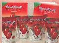
シシリアンルージュピュール (横手市)