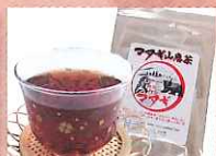
マタギ山恵茶 (マタギの里かんじき工房)