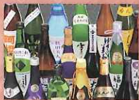
地酒 (秋田県酒造協同組合)