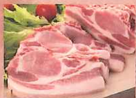
十和田湖高原ポーク桃豚 (南ポークランド)