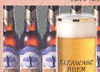
地ビール (田沢湖ビール)