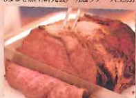
かづの短角牛 (秋田県畜産農業協同組合鹿角支所)