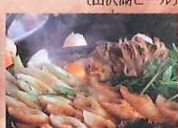
きりたんぼ鍋 (開気な母さんの店/椿山荘比内地鶏)