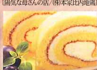
米粉スイーツ ((株)四季業)