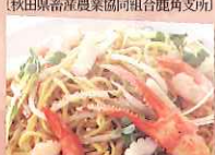
男鹿しよつる焼きそば (男鹿市商工会)