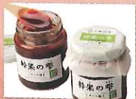
粋果の雫(すいか糖) (おものがわ夢工房)