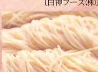
米粉麺 (南近藤製麺所)