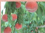
かづの北限の桃 (かづの農業協同組合)