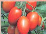
シシリアンルージュ(トマト)