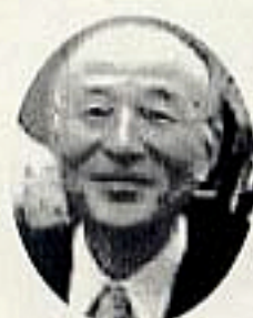
橋本五郎 読売新聞